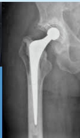
Bild till höger: Efter en höftplastikoperation. Metalldelen i den nya leden syns tydligt i vitt.