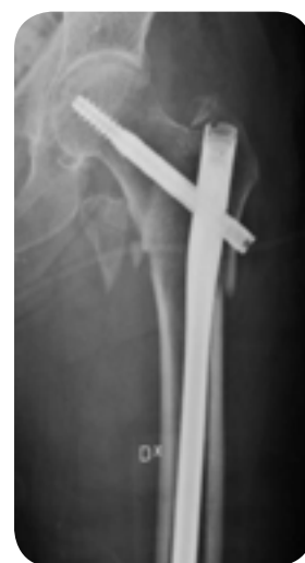
Fraktur fixerad med märgspik (efter operation)

I Sverige registreras alla patienter som opereras för höftfraktur i ett nationellt kvalitetsregister. Detta ger möjlighet att ständigt förbättra resultaten. Alla personuppgifter är sekretessbelagda. Som patient har du rätt att avstå från att ingå i registret, meddela i så fall din behandlande läkare.