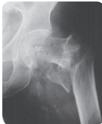
Felställd fraktur på lårbenet nedanför lårbenshalsen (före operation)

De flesta patienter är i pensionsålder men även unga kan drabbas. Då är sjukskrivningstiden helt beroende av typen av arbete.