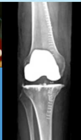
Bild till höger: Efter en knäplastikoperation. Metalldelen i den nya leden syns tydligt i vitt.